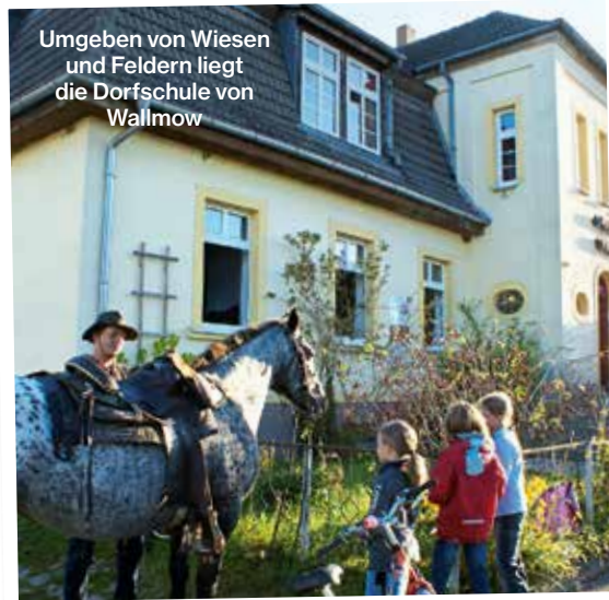
Umgeben von Wiesen und Feldern liegt die Dorfschule von Wallmow

In der Uckermark, die von Überalterung und mangelnder Infrastruktur geprägt ist, gilt das Dorf Wallmow als Perle. Von 250 Bewohnern sind 70 Kinder. Dank des Vereins Zuckermark e. V., der von zugezogenen Familien 1995 gegründet wurde, gibt es hier heute Grundschule, Kita, Hort und Jugendkunstschule. Geschafft wurde das durch Eigeninitiative, Fördermittel und die Unterstützung der „Aktion Mensch“.