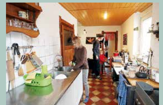
In der gemütlichen Küche verarbeitet das Paar viele Obst- und Gemüsesorten aus dem eigenen Garten