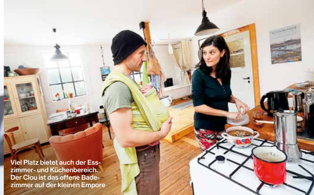
Viel Platz bietet auch der Esszimmer- und Küchenbereich. Der Clou ist das offene Badezimmer auf der kleinen Empore

„Seit ich hier lebe, bin ich endlich glücklich!“