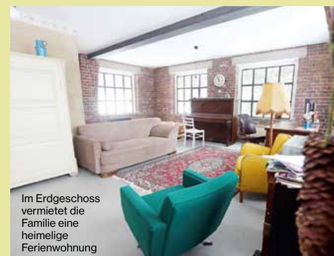
Im Erdgeschoss vermietet die Familie eine heimelige Ferienwohnung

René Eckert, 38, aus Auerbach musste erst durch die ganze Welt reisen, um zu merken, dass es in seiner Heimat am schönsten