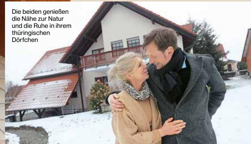
Die beiden genießen die Nähe zur Natur und die Ruhe in ihrem thüringischen Dörfchen

habe ich heute nicht mehr.“ Vermissen würde er nichts auf dem Land. Im Gegenteil, das Leben fühle sich hier an wie Urlaub. Gedanken über das Älterwerden macht er sich schon hin und wieder. „Aber wenn wir hier nicht mehr leben können, dann ziehen wir eben zurück in die Stadt. Doch so lange es geht, genießen wir es.“