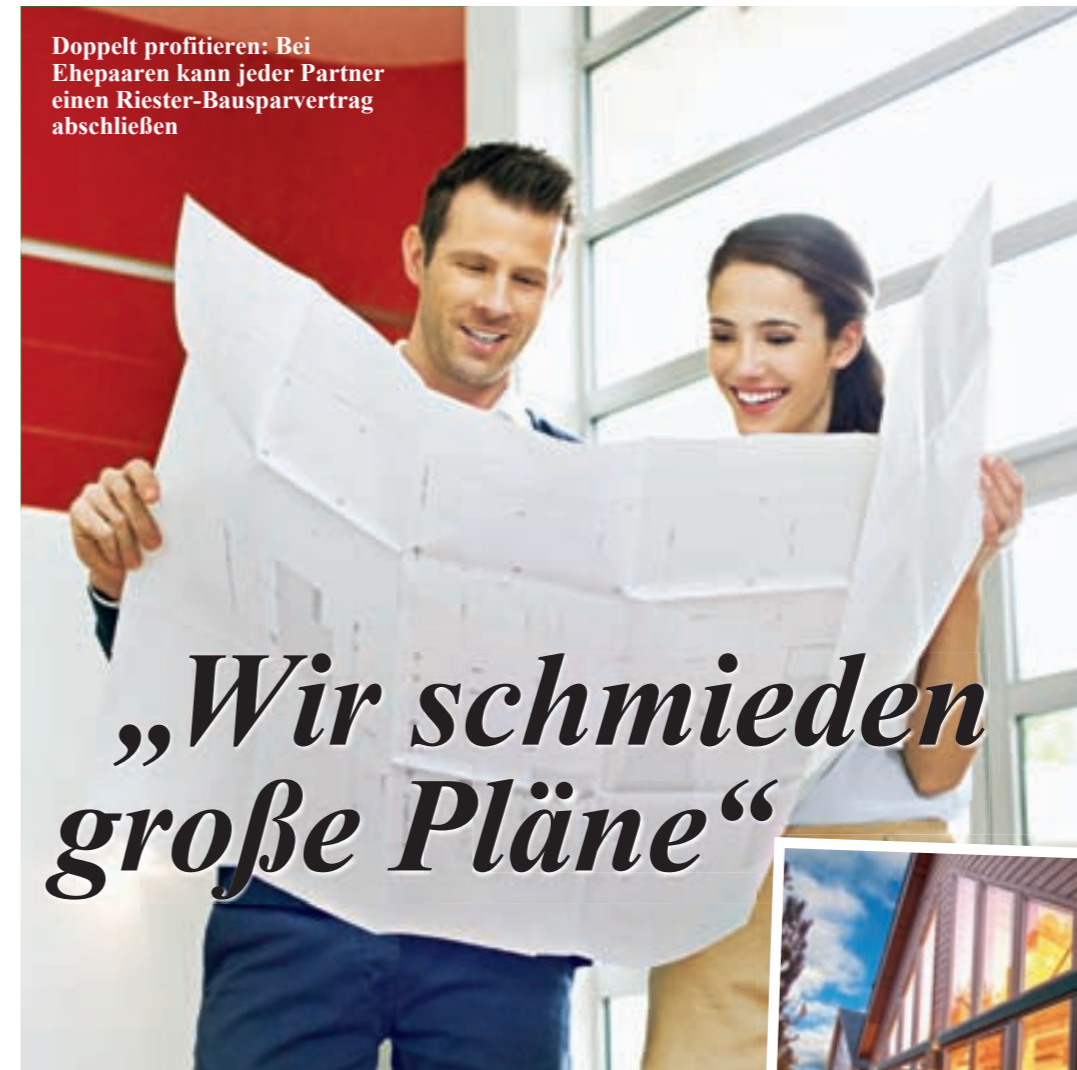
Doppelt profitieren: Bei Ehepaaren kann jeder Partner einen Riester-Bausparvertrag abschließen